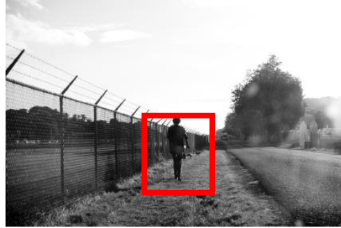
Figuur 2: Detectie met behulp van videocontentanalyse.

Bij videocontentanalyse voor buitenbeveiliging is het mogelijk om personen automatisch te detecteren en kan een meldkamer direct het betreffende videobeeld gepresteerd krijgen. Ook kan een systeem een duidelijk onderscheid maken tussen personen en bijvoorbeeld een konijn dat in het beeldvlak van de camera loopt. In onderstaande afbeelding ziet u een kader dat door videocontentanalyse automatisch om een persoon wordt heen gelegd en doorgestuurd kan worden naar de centralist van een meldkamer.