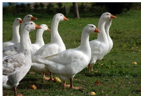
Figuur 1: Ganzen onderdeel van de omtrekbeveiliging bij een politiebureau in Brazilië.

Het toen gehanteerde security concept van een eerste barrière, vroegtijdige detectie en signalering, vertraging en adequate opvolging is nu nog steeds een basisprincipe voor buitenbeveiliging.