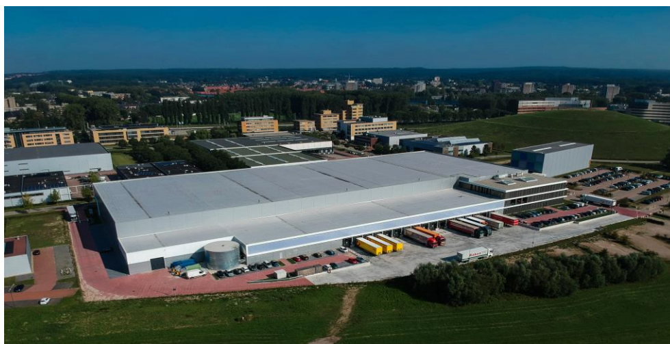
Nieuw warehouse Bunzl