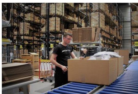
Doordat logistieke processen in het nieuwe EDC optimaal gestroomlijnd zijn, wist REV'IT! een forse efficiëncyslag te maken.