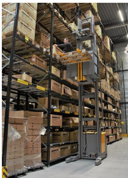
In de nieuwbouw worden producten tot een afzethoogte van 13 meter opgeslagen en gepickt.

Daarnaast zijn de logistieke processen gestroomlijnd en efficiënt. Waar in de oude situatie veel producten hangend werden opgeslagen, heeft REV'IT! er nu voor gekozen om die producten flatpack op te slaan. "Extra handling is zo geëlimineerd en het scheelt ook nog eens zo'n 25 procent in opslagcapaciteit", weet Ivan Vos. "Ook hebben we substantieel – tot wel 30 procent – minder flexkrachten nodig en hoeven we orders niet meer te splitsen, waardoor de transportkosten voor outbound zijn gedaald."