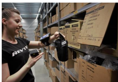
Orders worden niet meer gesplitst, waardoor onder andere de transportkosten zijn gedaald.