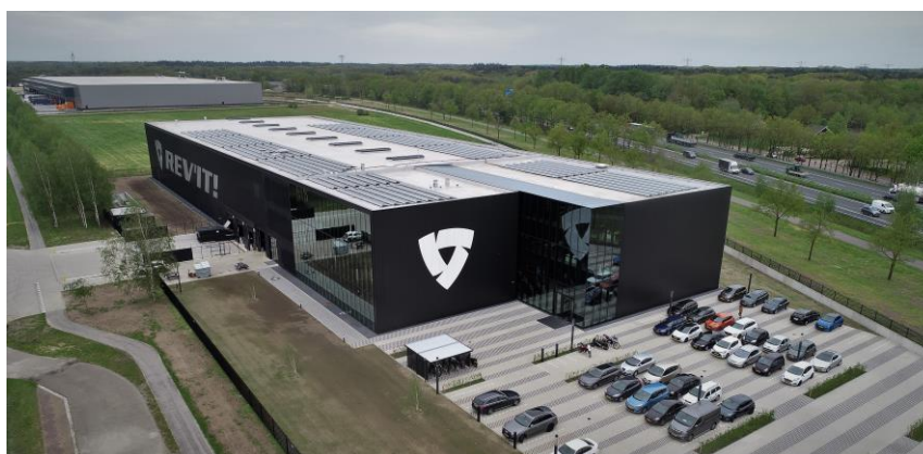
Het nieuwe, centrale Europees dc van REV'IT! in Oss is speciaal ontworpen om de groeiambities van de motorkledingproducent te faciliteren.

“Als gevolg van ons succes werd de situatie in Oss echter steeds lastiger”, vervolgt de managing director. “We zaten in drie panden, waardoor processen – zowel op kantoor als in het magazijn – heel inefficiënt verliepen. Orders werden bijvoorbeeld op twee locaties gepickt, waardoor we continu de bezetting moesten afstemmen. Ook werden orders soms opgesplitst en in aparte zendingen afgeleverd bij onze dealers. Kortom: hoog tijd voor een nieuw jasje.”