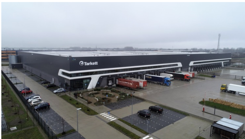
Het nieuwe distributiecentrum op bedrijvenpark Prologis Park Waalwijk telt 26.000 m 2 . Iets meer dan de helft hiervan wordt gehuurd door Tarkett.

Het te krappe jasje resulteerde daarnaast in efficiencyverlies. Als gevolg van het ruimtegebrek was Tarkett genoodzaakt om delen van de voorraad op andere locaties op te slaan. "Op een gegeven moment moesten we zelfs externe opslagruimte huren. Met onnodige handling en extra transportkilometers tot gevolg", vervolgt Van der Zanden. "Bovendien kwam daardoor de leverbetrouwbaarheid en de service naar onze klant in gevaar. Ruimte genoeg voor verbetering."