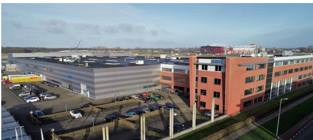
ERIKS is één van de grootste industriële serviceproviders wereldwijd.

Het was voor ERIKS reden om Groenewout te vragen nogmaals te kijken naar een studie die in 2016 al door hen werd uitgevoerd. Van Haastrecht: "We hebben Groenewout gevraagd om te kijken of er potentie is voor één Europese supply chain; met geconsolideerde voorraden en een kleiner aantal locaties. Deze locaties zijn dan wel voor hun nieuwe functie geoptimaliseerd. Ons onderbuikgevoel zei dat die potentie er is, maar dat wilden we natuurlijk eerst goed onderbouwd hebben voordat we knopen zouden doorhakken."